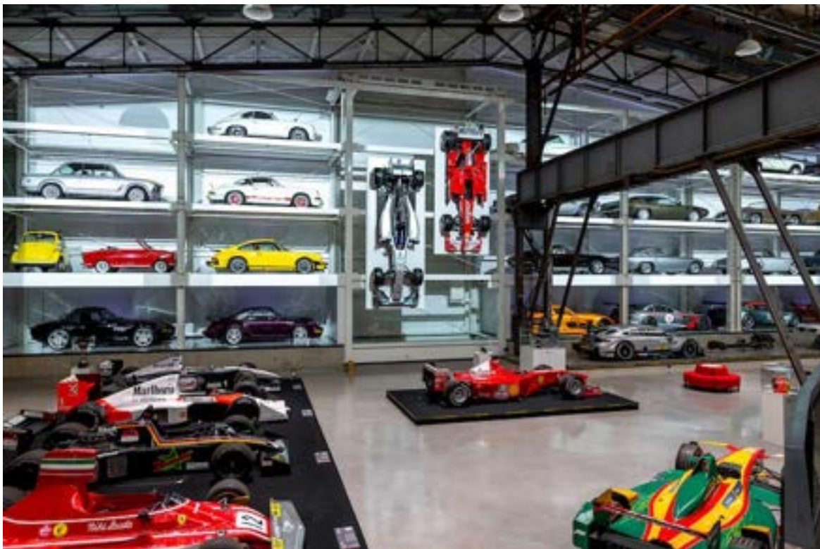
Von NASCAR bis Formel 1: Auch für Rennsportfans ist im Nationalen Automuseum The Loh Collection einiges geboten.