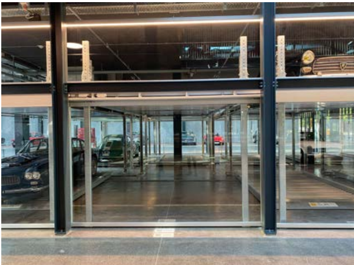
Ausstellen statt Abstellen: Die Schaugarage im Classic Car House. © WÖHR Autoparksysteme GmbH