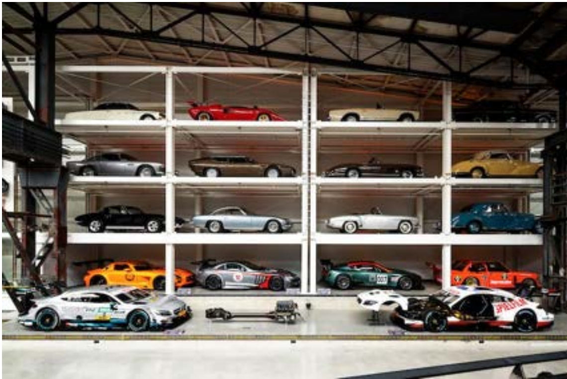
Nicht nur praktisch, sondern auch ein echter Hingucker: Die beiden WÖHR Slimparker 557 präsentieren 22 der rund 150 Sammlerstücke eindrucksvoll an der Innenfassade.