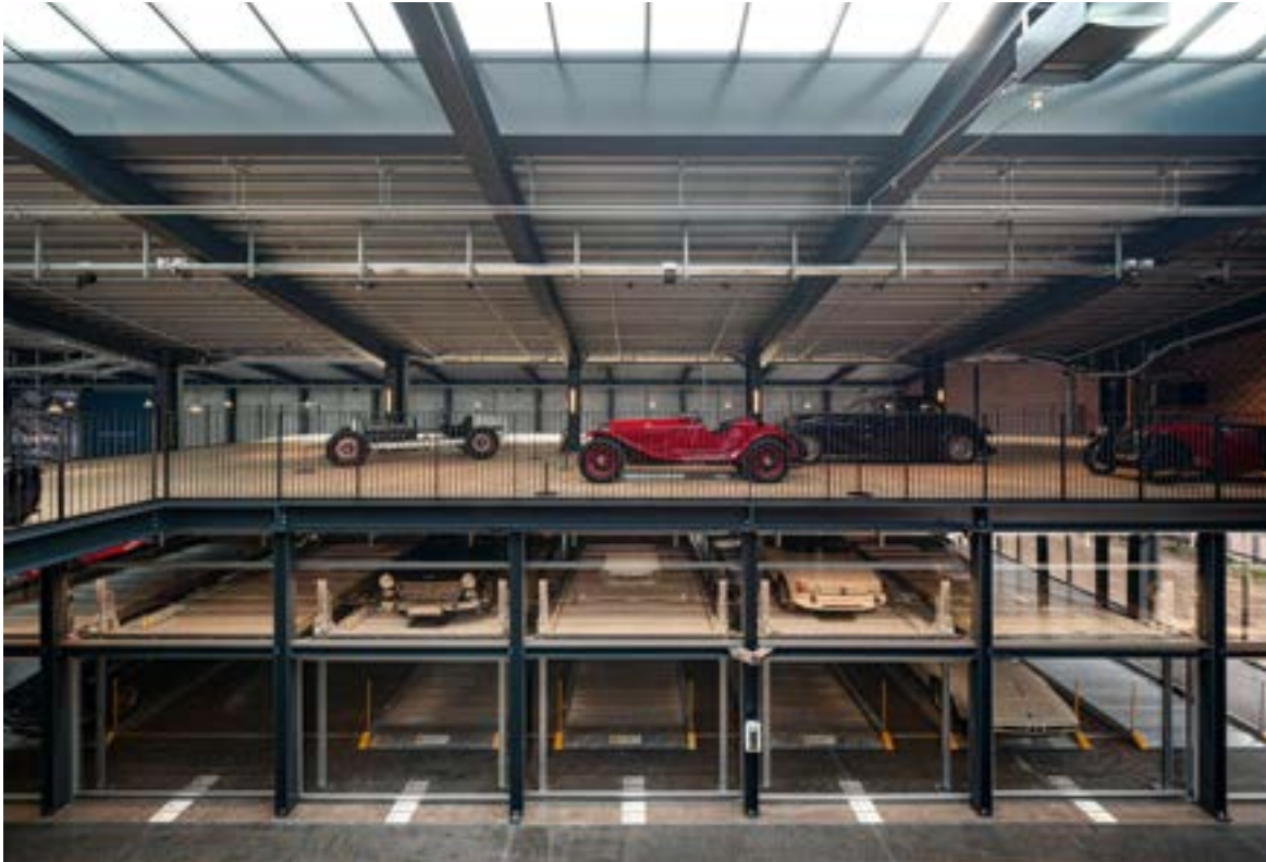
Ein Gesamterlebnis für Autosammler:innen und -liebhaber:innen aus der ganzen Welt: Das Classic Car House bei Kopenhagen.

Parken als Kunstform: Seit 2023 setzen gleich zwei international bedeutende Museen zur Automobilgeschichte auf Parklösungen von WÖHR Autoparksysteme GmbH. Das Nationale Automuseum The Loh Collection in Dietzhölztal-Ewersbach und das Classic Car House im dänischen Lyngby, nahe der Hauptstadt Kopenhagen, präsentieren auf den digital gesteuerten Plattformen von WÖHR Autoparksysteme Designikonen, Unikate und Sammlerstücke – darunter legendäre Fahrzeuge von prominenten Fahrern wie Michael Schumacher und John F. Kennedy.