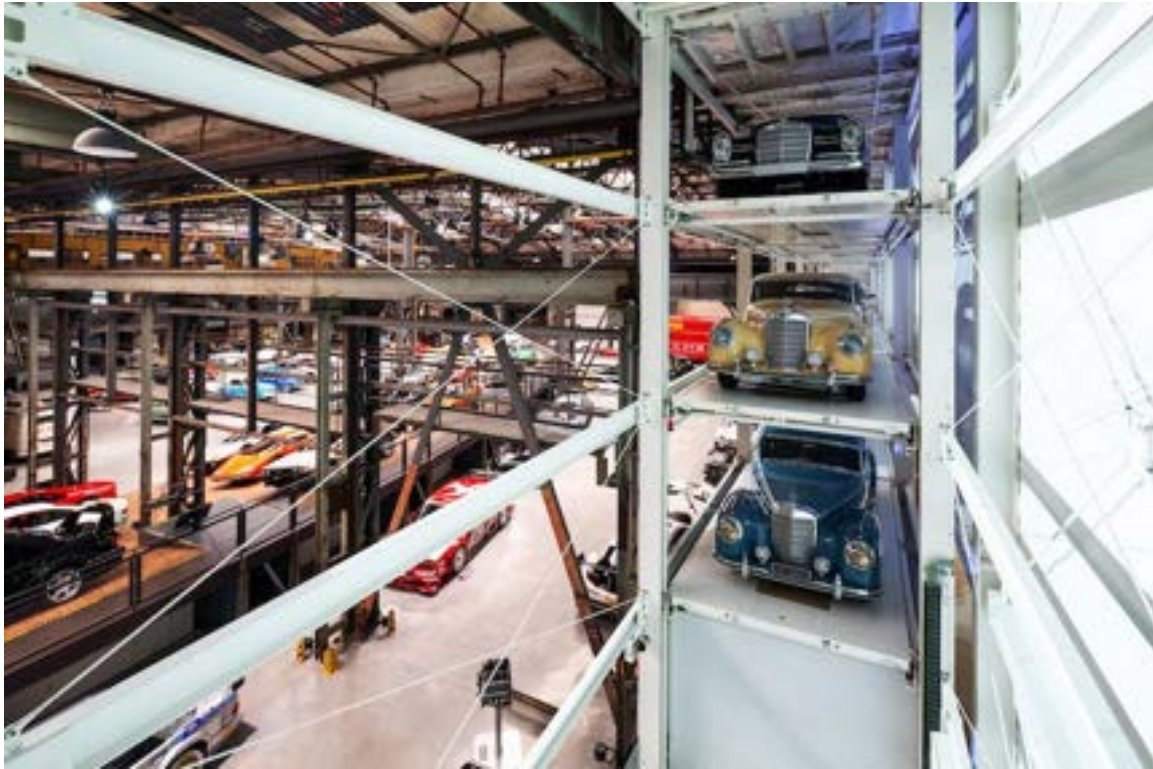
Einfach, sicher, platzsparend: Im WÖHR Slimparker 557 werden Fahrzeuge mit bis zu 5,30 Metern Länge auf drei Ebenen untergebracht.