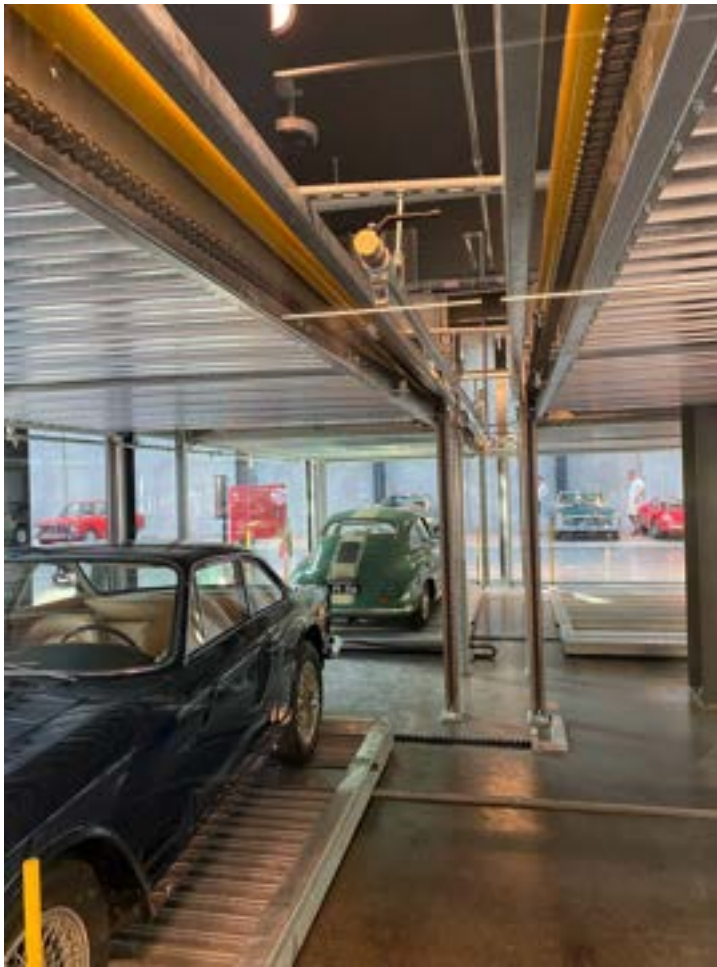
Moderne Parklösung für klassische Fahrzeuge: In den drei Exemplaren des WÖHR Combilift 552 finden insgesamt 43 Sammlerstücke Platz. © WÖHR Autoparksysteme GmbH