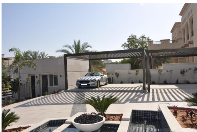
Bild 3: Im abgesenkter Stellung schließt die Deckelplattform bodenbündig ab und weist denselben Belag wie der übrige Innenhof auf.