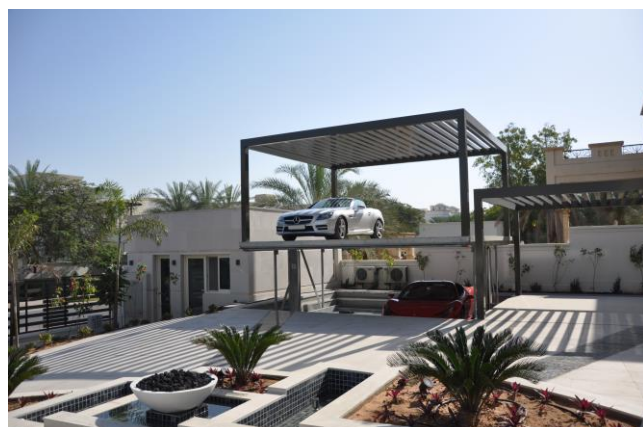
Bild 1 und 2: Der Parklift 461 D bietet zwei unterirdische Stellplätze. Durch eine geringe Modifikation der Deckelplattform und das Anbringen des Carports, entstehen zwei weitere Stellplätze auf der oberen Ebene.